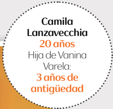
Camila Lanzavecchia 20 años Hija de Vanina Varela: 3 años de antigüedad